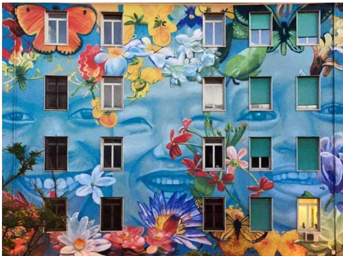
Decorazione della facciata della sede centrale di viale Odescalchi, 75 dello street artist Gaia